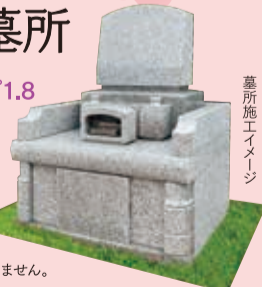
墓所施工イメージ

※年間管理料・手桶使用料は別途かかります。※永代使用料に消費税はかかりません。 ※数に限りがございます。売り切れの際はご容赦ください。