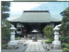
1.8m区画墓所 永代供養付き個別墓所